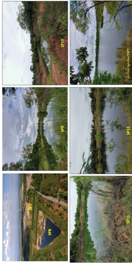
รูปที่ 5.1-8 ภาพถ่ายแสดงบ่อดักตะกอนที่ 7, 8, 9, 10, 11 และ 12 และบ่อรับน้ำฉุกเฉิน