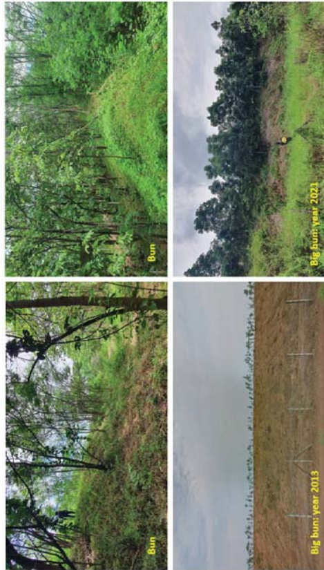
รูปที่ 5.1-6 ภาพถ่ายแสดงแนวคันดินขนาดปกติ (bun) และแนวคันดินขนาดใหญ่

นอกเหนือจากพื้นที่แนวคันดินที่ขุดขึ้นโดยรอบบ่อเหมืองต่างๆแล้ว ยังมีแนวคันดินขนาดปกติ มีความสูง 2.5 ม. ฐานกว้างประมาณ 5 ม. และคันดินขนาดใหญ่ มีความสูง 5 ม. ฐานกว้างประมาณ 1-3 ม. ฐานกว้างประมาณ 10-15 ม. (รูปที่ 5.1-6) ที่มีวัตถุประสงค์ในการสร้างเพื่อป้องกันเสียง และฝุ่น รวมทั้งปรับทัศนียภาพในการมองเห็น โดยการปลูกไม้ยืนต้น ประเภท สะเดา ประดู่ ยูคา ก้ามปู หางนกยูง กระถินณรงค์ ขี้เหล็ก และแคป้า อีกทั้งยังเป็นแนวกันทิศทางการไหลของน้ำผิวดิน เพื่อบังคับให้ไหลไปยังพื้นที่รับน้ำ หรือบ่อตกตะกอนอีกด้วย แนวคันดินขนาดปกติ มีความยาวรวมประมาณ 13,720 ม. คิดเป็นเนื้อที่ฐานประมาณ 42 ไร่ ส่วนแนวคันดินขนาดใหญ่ มีความยาวรวมประมาณ 8,240 ม. คิดเป็นเนื้อที่ฐานประมาณ 64 ไร่