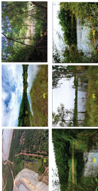
รูปที่ 5.1-7 ภาพถ่ายแสดงบ่อตกตะกอนที่ 1, 2, 3, 4, 5, และ 6 ในพื้นที่โครงการ

พื้นที่ส่วนใหญ่ยังไม่ได้ดำเนินการฟื้นฟู เนื่องจากยังถูกใช้งานอยู่ในปัจจุบัน มีเพียงการปลูกไม้ยืนต้นบริเวณขอบพื้นที่ และปลูกหญ้าแฝกตามพื้นที่ลาดชันเท่านั้น โดยมีการดำเนินการปลูกไม้ยืนต้นในกาพื้นที่ในพื้นพื้นที่ว่างบางส่วนที่ไม่ได้ใช้งานแล้ว