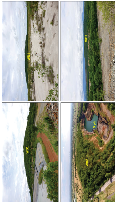
รูปที่ 5.1-4 ภาพถ่ายแสดงกองมูลหิน และพื้นที่ฟื้นฟูโดยการปลูกต้นไม้บริเวณกองมูลหินที่ 1 (ซ้ายบน) กองมูลหินที่ 2 (ซ้ายล่าง) และกองมูลหินที่ 3 (ขวาล่าง)