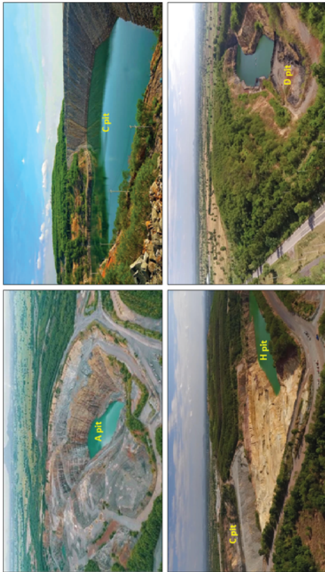
รูปที่ 5.1-2 ภาพถ่ายแสดงพื้นที่บ่อเหมือง A (ซ้ายบน) บ่อเหมือง C (ขวาบน) บ่อเหมือง CH (ซ้ายล่าง) และบ่อเหมือง D (ขวาล่าง)