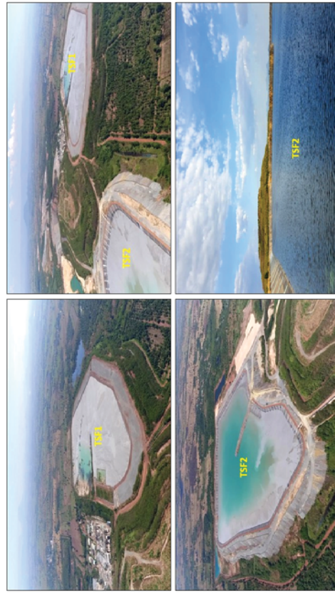
รูปที่ 5.1-9 ภาพถ่ายแสดงบ่อกักเก็บกากแร่ที่ 1 และ 2