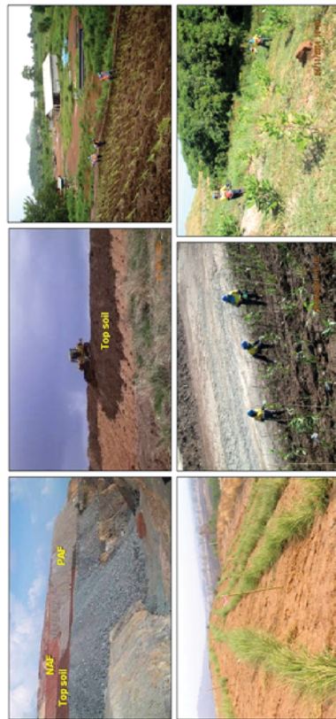
รูปที่ 5.1-11 ภาพถ่ายแสดงการเตรียมพื้นที่ก่อนการฟื้นฟู การปลูกหญ้าแฝก และไม้ยืนต้นต่างๆ

การฟื้นฟูพื้นที่ในช่วงที่ผ่านมา จะใช้ประโยชน์ไม่ท้องถิ่นเดิมที่มีทรงสูงและไต่เร็ว เช่น กระถินเทพา ประดู่บ้าน จีหลัก สะดา และทางแยกยูงแรง เป็นต้น นอกจากนี้ ได้พิจารณาพรรณไม้ที่เป็นไม้ผลเพื่อเป็นอาหาร แก่สัตว์ป่าและสัตว์จำพวกนก อาทิ เช่น หว่า ตะขบ และไทร เป็นต้น โดยในช่วงเริ่มต้นของการฟื้นฟู จะนำพืชคลุม ดินมาปลูกบริเวณพื้นที่โดยทั่วไปโดยเฉพาะพื้นที่ลาดชันของกองมูลหิน เพื่อป้องกันการชะล้างพังทลายของดิน ได้แก่ พืชคลุมดินประเภทหญ้า อาทิ หญ้าแฝก และพืชตระกูลถั่วอื่นๆ (รูปที่ 5.1-11 และรูปที่ 5.1-12)