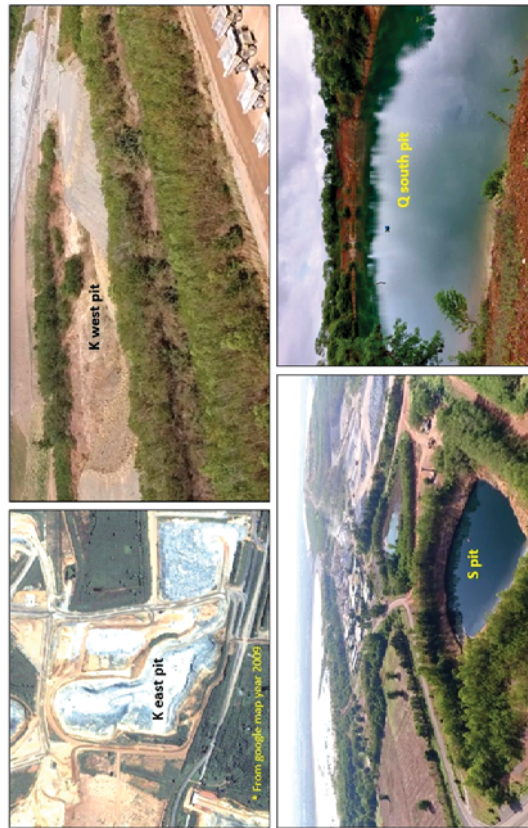
รูปที่ 5.1-3 ภาพถ่ายแสดงพื้นที่บ่อเหมือง Ke ขณะเปิดหน้าเหมือง (ซ้ายบน) บ่อเหมือง Kw (ขวาบน) บ่อเหมือง S (ซ้ายล่าง) และบ่อเหมือง Os (ขวาล่าง)

การฟื้นฟูพื้นที่จากการทำเหมืองในช่วงที่ผ่านมาโดยภาพรวม มีรายละเอียดดังนี้ (1) พื้นที่บ่อเหมือง