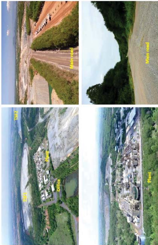
รูปที่ 5.1-10 ภาพถ่ายแสดงพื้นที่ใช้ประโยชน์อื่นๆ ในพื้นที่โครงการ

การฟื้นฟูพื้นที่ในช่วงที่ผ่านมา จะใช้ประโยชน์ไม่ท้องถิ่นเดิมที่มีทรงสูงและไต่เร็ว เช่น กระถินเทพา ประดู่บ้าน จีหลัก สะดา และทางแยกยูงแรง เป็นต้น นอกจากนี้ ได้พิจารณาพรรณไม้ที่เป็นไม้ผลเพื่อเป็นอาหาร แก่สัตว์ป่าและสัตว์จำพวกนก อาทิ เช่น หว่า ตะขบ และไทร เป็นต้น โดยในช่วงเริ่มต้นของการฟื้นฟู จะนำพืชคลุม ดินมาปลูกบริเวณพื้นที่โดยทั่วไปโดยเฉพาะพื้นที่ลาดชันของกองมูลหิน เพื่อป้องกันการชะล้างพังทลายของดิน ได้แก่ พืชคลุมดินประเภทหญ้า อาทิ หญ้าแฝก และพืชตระกูลถั่วอื่นๆ (รูปที่ 5.1-11 และรูปที่ 5.1-12)