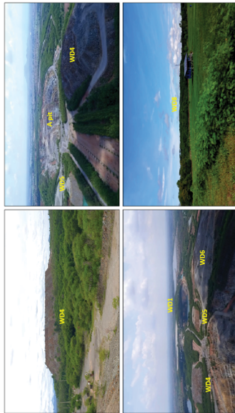
รูปที่ 5.1-5 ภาพถ่ายแสดงกองมูลหิน และพื้นที่ฟื้นฟูโดยการปลูกต้นไม้บางส่วนบริเวณกองมูลหินที่ 4 (ซ้ายบน) กองมูลหินที่ 4, 5 และ 6 (ซ้ายล่าง) และกองมูลหินที่ 8 (ขวาล่าง)